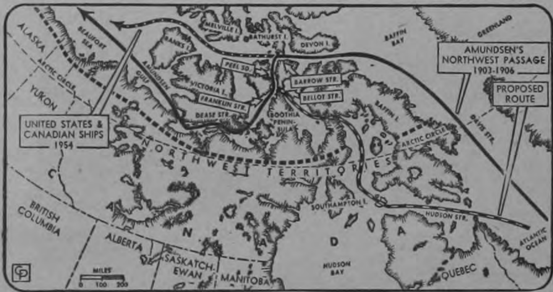
El mapa muestra la proyectada ruta del Paso del Noroeste comparada con la seguida por Amundsen.