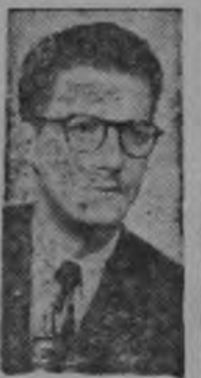
Chaverri B. pro salarios...

Ley de Salarios de la administración Pública