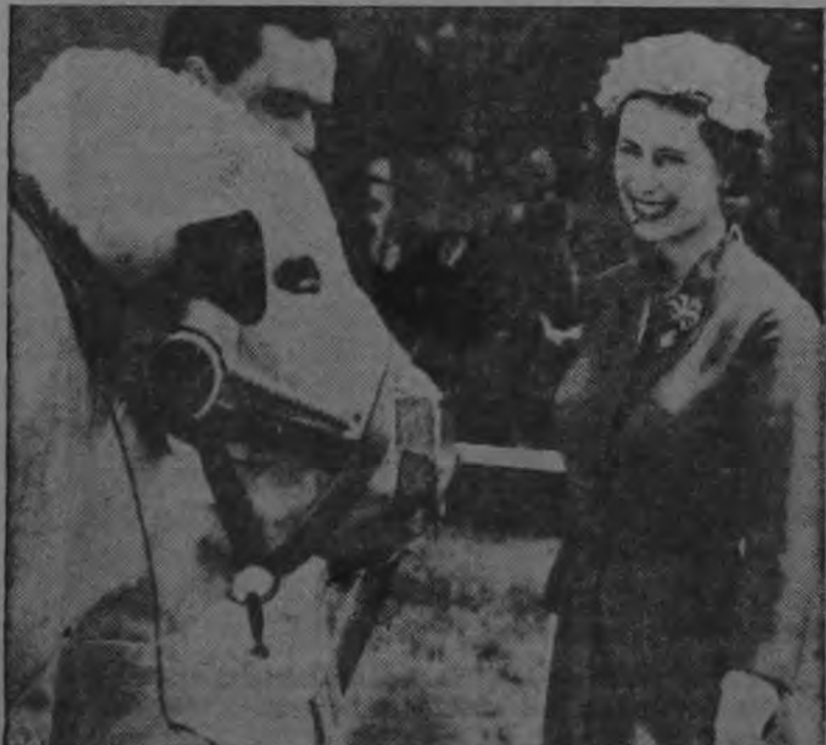
La real sonrisa de la Reina Isabel II de Inglaterra parece que no hace efecto en Heveringham Stonehenge, el toro premiado que admira en la Real Exposición Agrícola en Norwich, Inglaterra. El toro es un toro blanco británico y el primero de su casta particular que se exhibe en una exposición real desde 1939.